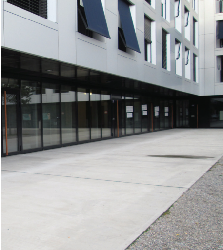
Leere Geschäftsräume in Neuhegi

als durch Wohnungen und Gewerbe die Rede sein. Auf computergenerierten Bildli tummeln sich schon heute Pendler*innen, Shopper*innen und Anwohner*innen. Die Frage sei erlaubt, ob da nicht eine Geisterstadt mit Verkehrsachsen für alle ausser Fussgänger*innen geplant wird. Die Erfahrungen mit den Siedlungen auf dem ehemaligen Sulzerareal lassen dies befürchten. Die Giesserei ist das einzige Wohnprojekt, das den per Gestaltungsplan verordneten Anteil an Gewerbeflächen (ca. 9%) erfüllt. In den benachbarten Siedlungen herrscht im Erdgeschoss tote Hose oder Leerstand. Ein möglicher Lösungsansatz aus SP-Sicht wäre, die Grundbesitzer zu verpflichten, leerstehende Gewerbeflächen zu günstigeren Mietzinsen anzubieten. Ob sie dann eine Querfi-